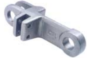
GK 142 STD (DBL) Bef.-Glied mit seitr. Schlitz Doppelstrang Attachment link with lateral slit, double-strand