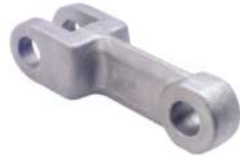
GK 142 HVY