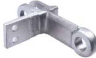
GK 142 CAM mit Bef.-Element für Doppelstrang with attachment element for double strand