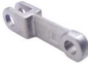
GK 142 STD