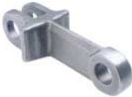
GK 142 CAM