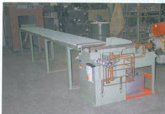
Federmontiermaschine Spring Mounting Machine