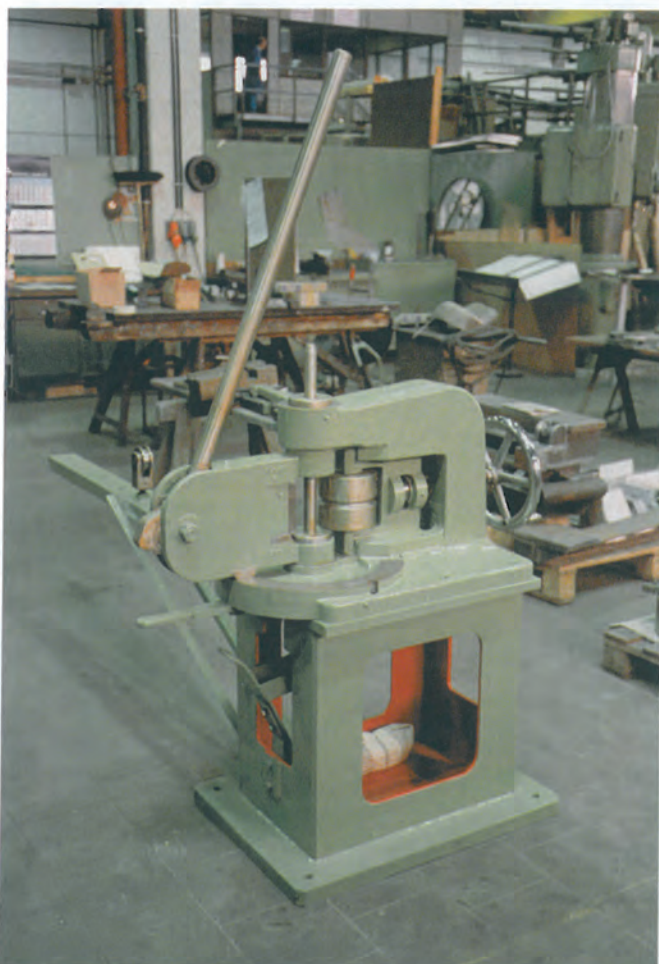
Mechanische Augenrollmaschine Mechanical Eye Rolling Machine