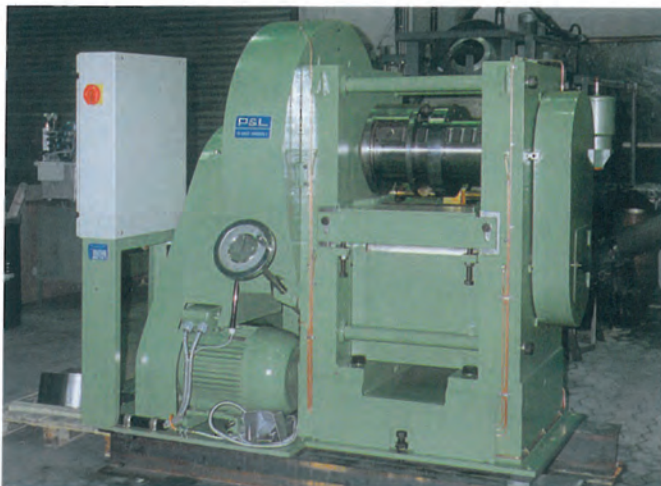
Schmiedewalzmaschine Taper Rolling Machine