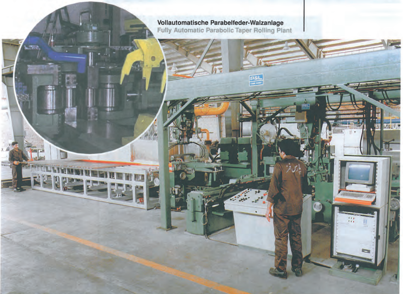
Vollautomatische Parabelfeder-Walzanlage Fully Automatic Parabolic Taper Rolling Plant